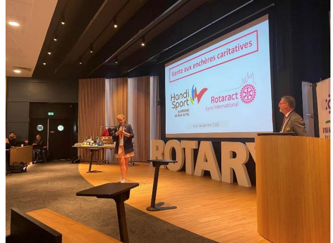
La vente aux Enchères a permis de collecter 1 600,00 € Belle action du ROTARACT Au profit de la ligue handisport