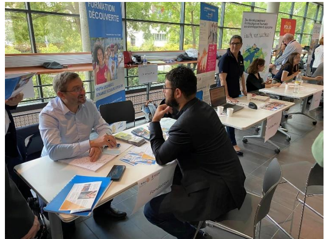
17 stands pour s'informer (Fondation, 100 ans du Rotary, Espoir en Tête, Worldskills, IRL, Shelterbox, Rotaract, etc.)