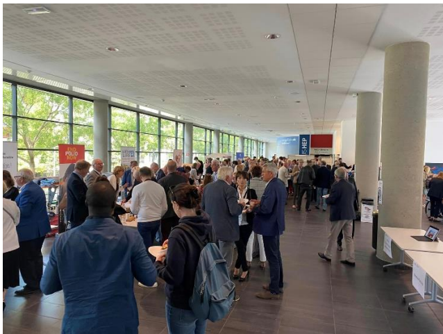
Repas -Buffet dans l'Atrium de l'IDRAC Moment d'échange